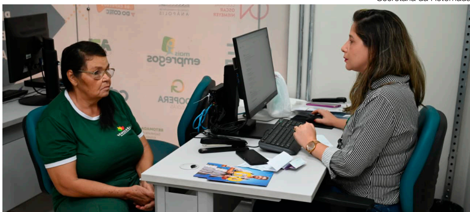
Secretaria da Retomada

O feirão será realizado na Central Mais Empregos do Governo de Goiás (Avenida Araguaia, esquina com a Rua 15, Centro), das 8h às 17h. Considerando também as oportunidades voltadas ao público em geral, serão cerca de 13 mil vagas