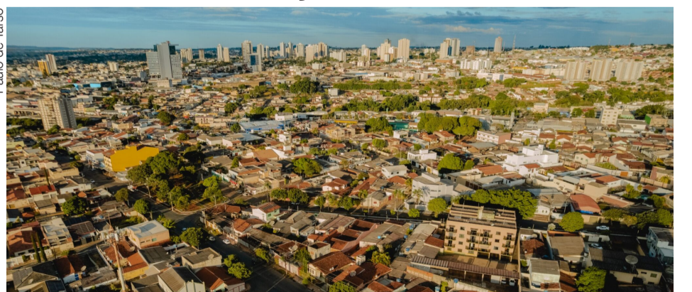
Paulo de Tarso

Anápolis realiza oficinas para discutir mudanças no Plano Diretor