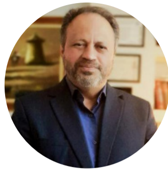
MANOEL L. BEZERRA ROCHA @manoellbezerrarocho