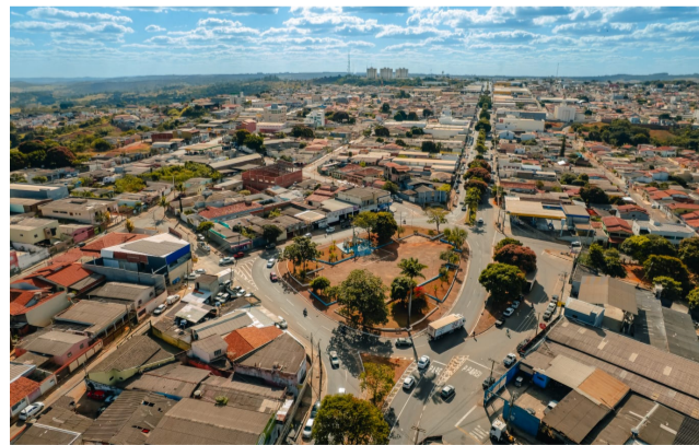
Paulo de Tarso

Os interessados podem solicitar a adesão ao programa de forma online pelo Zap da Prefeitura, no número (62) 3902-2882, ou presencialmente no Rápido, localizado no AnaShopping. Após o pagamento do imposto, o contribuinte deve apre-