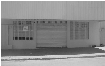
Sala Comercial para aluguel na Av. C, Itaguaí II com 100 m²