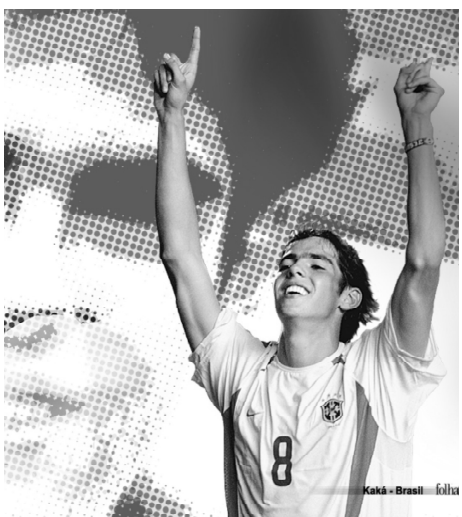
Kaká - Brasil - folha

A temporada europeia ainda nem acabou e as especulações sobre a ida de Kaká para o Real Madrid já voltaram com força total na Espanha. Nesta quarta-feira, o jornal "As" diz que o clube está disposto a pagar 60 milhões (R$ 157 milhões) ao Milan para ter o brasileiro.