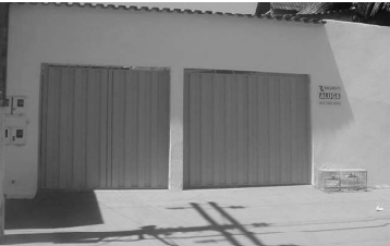
CASA na Estância dos Buritis para aluguel, com 3 quartos, sendo 1 suíte, sala, coz., 2 garagens