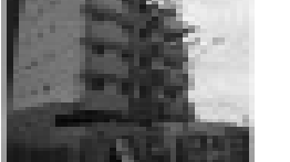
Appto. mobiliado no Res. Varanda dos Buritis com 1 quarto, sala, cozinha, banheiro social, sacada, garagem, piscina e estacionamento