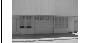
Sala Comercial para aluguel na Av. C, Itaguaí II com 100 m².