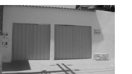
CASA na Estância dos Buritis para aluguel, com 3 quartos, sendo 1 suite, sala, coz., 2 garagens