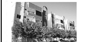
APTO. no Res. Varanda dos Buritis para aluguel com 1 quarto, sala, cozinha, banheiro social, garagem, parque aquático.