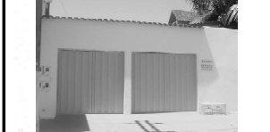
CASA na Nova Vila para aluguel, av. B, 3/4 sendo 1 suite, sala, coz., 2 garagens