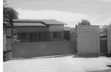
CASA na Estância dos Buritis para aluguel, com 3 quartos, sendo 1 suite, sala, coz., 2 garagens