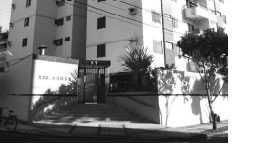
COBERTURA no Res. Aruba, com 5 quartos, sendo 4 suites, sala, cozinha, banheiro social, sacadas, área de serviço, garagem, piscina