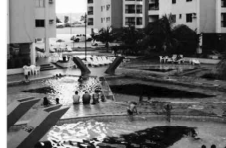
APTO. mobiliado do Res. Águas da Fonte com 1 quarto, sala, cozinha, banheiro social, sacada, com parque aquático