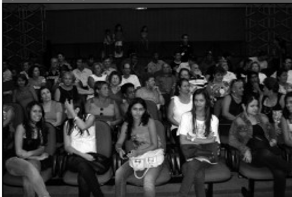
Caravana de Caldas Novas na platéia da TV Brasil Central, durante gravação do Cidade Esperança