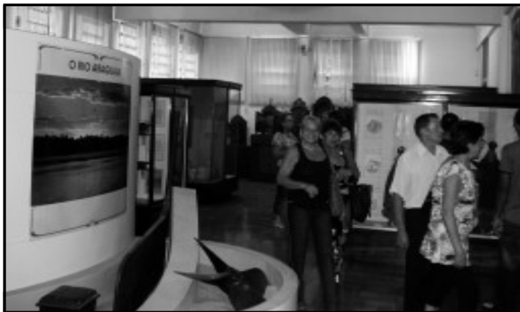
Visita ao Museu Goiano Zoroastro Artiaga também fez parte do passeio

A Caravana de cada município fica responsável de levar pessoas para participar da platéia do programa e atrações locais, os artistas levados daqui foram a dupla sertaneja Guilherme e