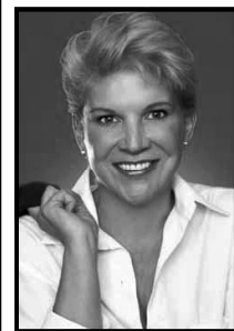
Marta Suplicy Ex Prefeita de São Paulo