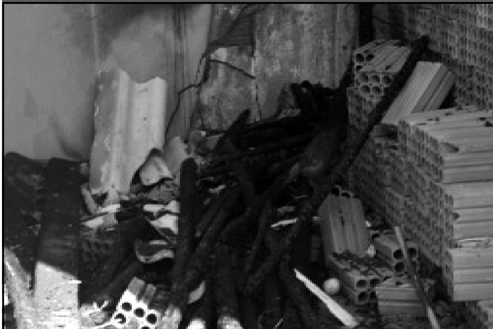
Foco do Incêndio ocorrido no comitê do PSC

Se até agora a campanha eleitoral em Caldas Novas dava ares de inverno a passos lentos, desde o sábado, 26, isto não pode mais ser dito. O incêndio – com cara e jeito de