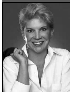
Marta Suplicy Ex Prefeita de São Paulo