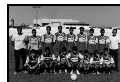
Sub - 15 Itumbiara