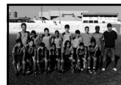
Sub - 13 Hidrolândia