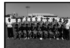
Sub - 17 Itumbiara