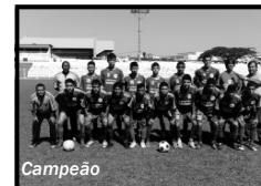
Sub - 17 Hidrolândia