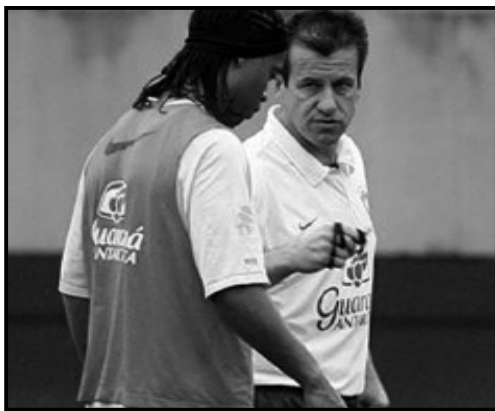
Ronaldinho e Dunga conversam durante treino da seleção

Dunga se preocupou na primeira parte do treino com o setor defensivo. Ele trabalhou a marcação e a saída de bola. Depois foi a vez do ataque. E aí Ronaldinho Gaúcho jogava com Pato no ataque e os volantes chegavam bastan-