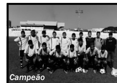
Sub - 15 Hidrolândia