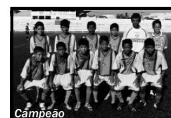
Sub - 13 Albatroz PA