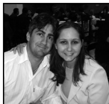
Malv-lara e esposo convidados prestigiando a Inauguração da choperla