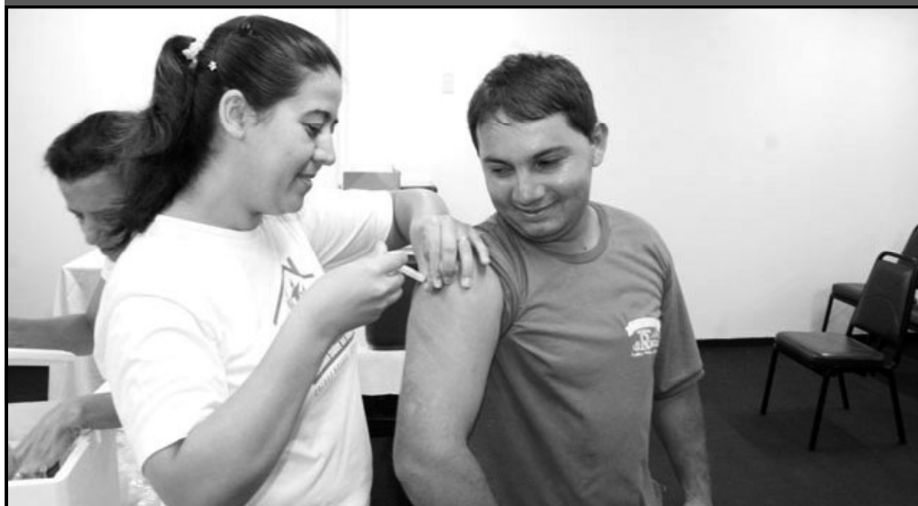
Campanhas contra a poliomielite e a rubéola começam a partir da primeira semana de agosto

No dia 9 de agosto a Secretaria Municipal de Saúde de Caldas Novas e o Núcleo de Vigilância Epidemiológica vão realizar a segunda etapa da Campanha de Vacinação Contra Poliomielite. O horário de atendimento