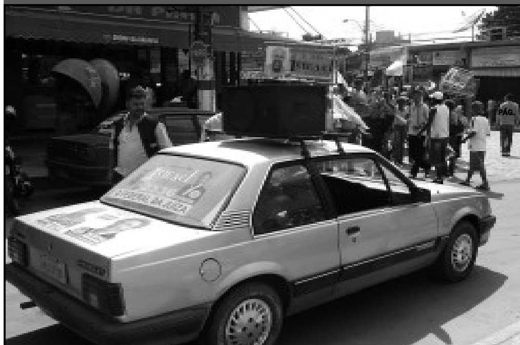
Carro de som e cabos eleitorais em cidade do Interior do Rio de Janeiro

A campanha eleitoral foi reduzida a um movimento silencioso e tímido em pelo menos 11 municípios do interior de