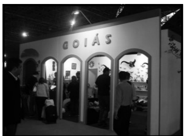
Stand de Artesanato Goiás