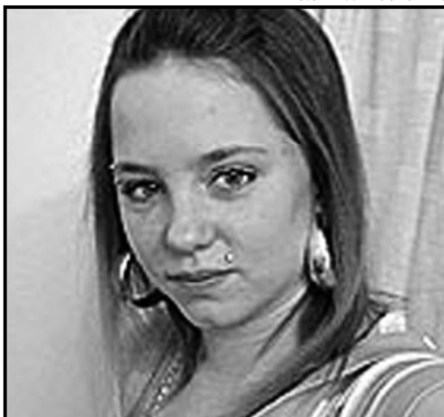
Inglesa foi esquartejada em Goiânia

garota para obter o visto para entrar e viver na Europa.