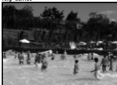
Praia do Cerrado