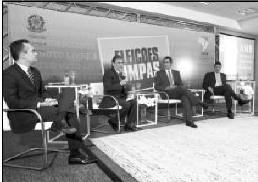
Presidente do TSE participa do lançamento da Campanha Eleições Limpas

Nesta terça-feira (26) toda a Justiça Eleitoral do Brasil participa da campanha Eleições Limpas, que é uma