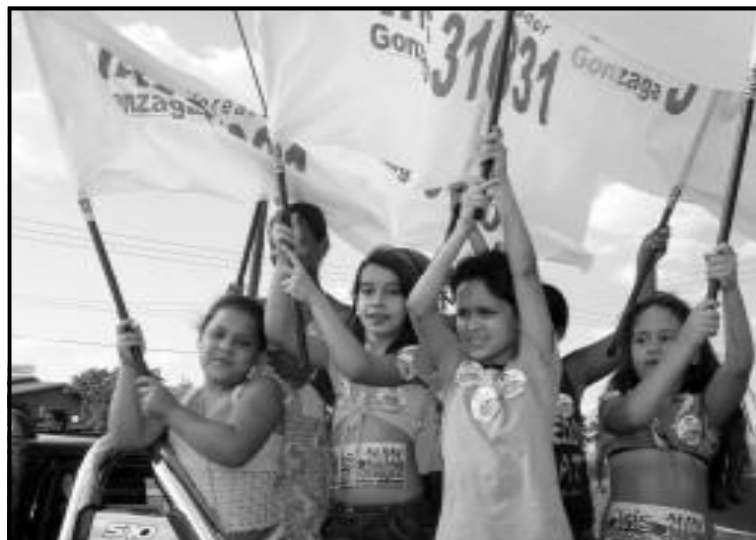
Público infantil era um dos mais animados - todos sabiam os jingles de cor