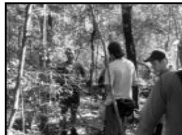
Trilha na Estância Mimosa