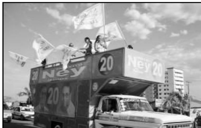
O já conhecido Trio de Ney acompanha caminhadas e também liderou a carreata da última sexta-feira, 29