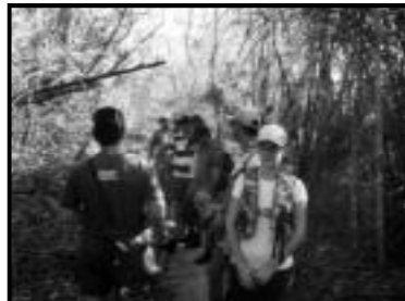
Primeira trilha rumo às cachoeiras