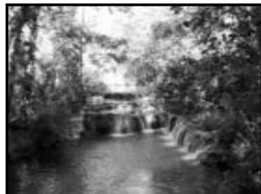
Cachoeiras da Estância Mimosa