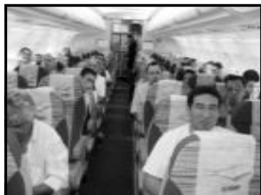
Representantes de Caldas Novas, Rio Quente, Goiás e consultores do SEBRAE GO, no avião

monia no meio ambiente e na comunidade. O lazer e a diversão são fundamentais para o processo de cura de qualquer doença, assim como uma boa alimentação e pelo menos 30 minutos de exercícios físicos diários. Tudo deve ser feito com equilíbrio e moderação. Sigam essas dicas e terão vida longa, saudável e produtiva.