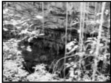
Gruta do Lago Azul