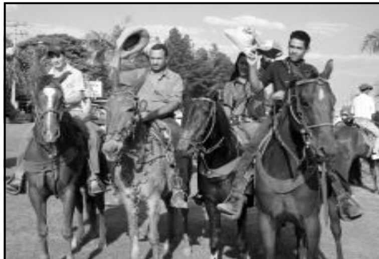
Partiu da população rural a iniciativa de reunir veículos e animais em uma tratorada