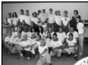
Grupo de Trabalho do SEBRAE, Caldas Novas, Rio Quente e cidade de Goiás