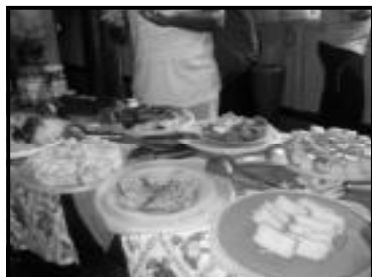
Café da Manhã na Estância Mimosa