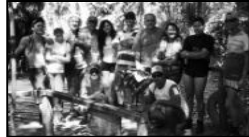
Grupo de Rio Quente, Caldas e Goiás nas cachoeiras