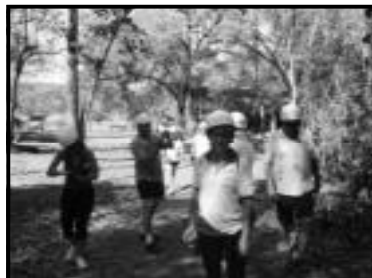
Primeiro passeio na Gruta do Lago Azul