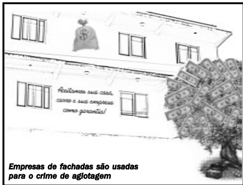
Empresas de fachadas são usadas para o crime de agiotagem

Empréstimos criminosos a juros extorsivos crescem 25% ao ano, fazem 2 milhões de vítimas e preocupam o Banco Central