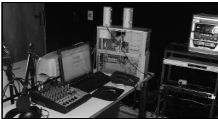
Transmissor e CPU foram apreendidos indevidamente pela ANATEL