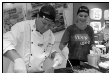
Vilma Alimentos - macarrão em formato de arroz