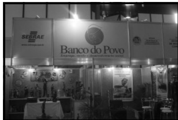
Banco do Povo