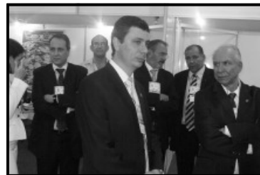
Stand Caldas Novas