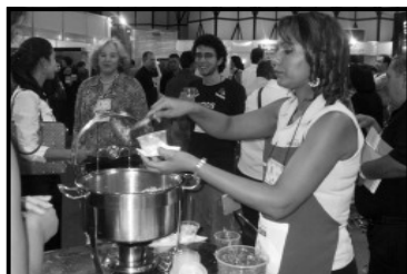
Arroz Dona Cota