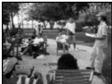
Estudo na Estância do Rio da Prata