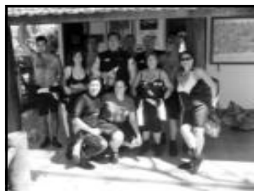
Equipe de Caldas, Rio Quente, Golás prontos para o mergulho no Rio da Prata