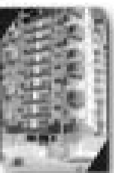
Complexo por três quartos, sendo uma suíte, dois banheiros, cozinha completa, área de lazer com churrasqueira, piscina, quadra esportiva, 10' de frente para a praia, Praia de pedregal