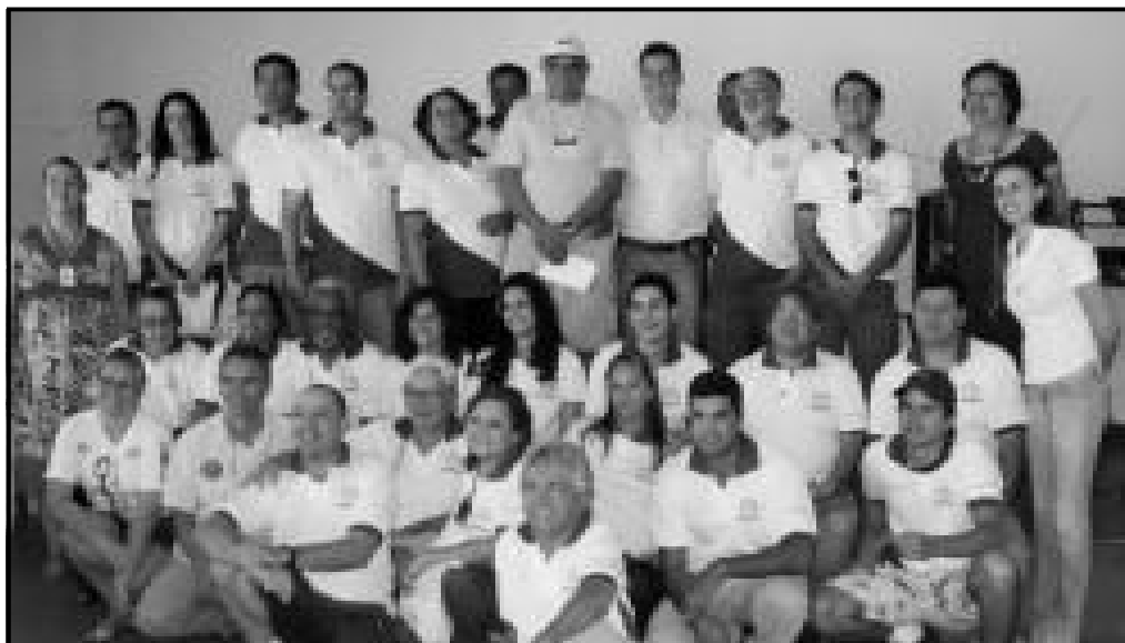
Grupo de Trabalho do SEBRAE, Caldas Novas, Rio Quente e cidade de Golás

A "Missão Empresarial e Visita Técnica do Sebrae à Bonito - Mato Grosso do Sul" aconteceu do dia 24 a 28 de agosto e participaram 30 pessoas, das cidades de Caldas Novas, Rio Quente e Goiás. Foi uma viagem inesquecível, cheia de aprendizado e oportunidades, lugares lindos e pessoas maravilhosas. Bonito é realmente lindo. A integração e harmonia com a natureza era visível em todos os aspectos. Foi uma troca de experiências muito gratificante e cheia de novidades. Levamos nossa alegria, nossas vivências e nossas culturas e recebemos uma lição muito importante de respeito à natureza e ao meio ambiente.