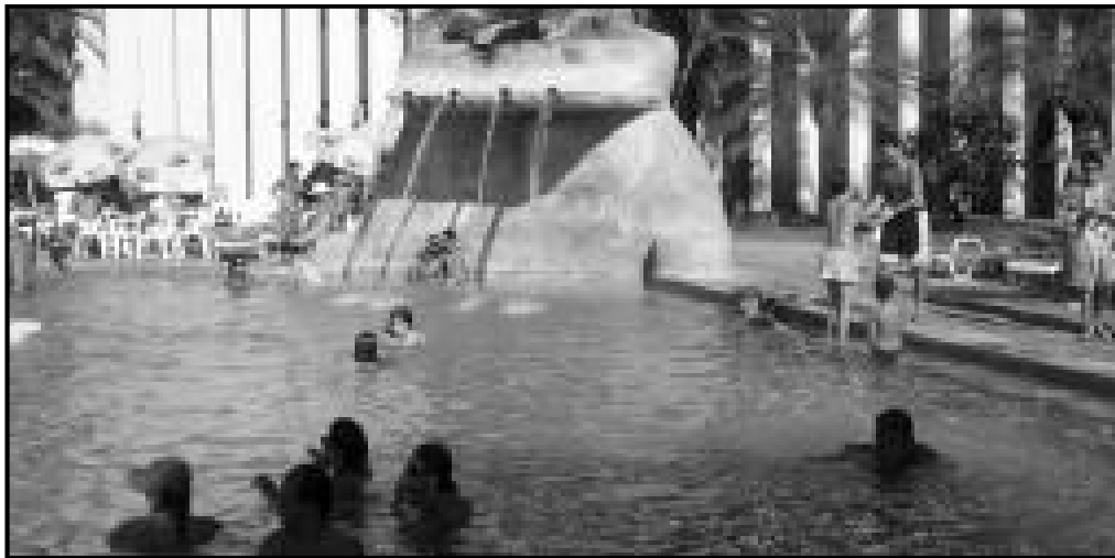
Piscina do CTC - um dos mais tradicionais Hotéis da cidade de Caldas Novas

O período que engloba os meses de setembro a novembro em Caldas Novas é considerado como baixa temporada. Em 2008, ainda existe o problema dos feriados nacionais prolongados, que praticamente inexistem. O feriado de 7 de setembro caiu no domingo, outubro não terá feriados e 15 de novembro, feriado de proclamação da República, será num sábado. Mas esses fatores não desanimam a classe hoteleira. Os números falam por si próprios: as reservas para o último fim de semana (27 e 28 de setembro) indicavam que grande parte dos empreendimentos estava com ocupação de 100% dos leitos.