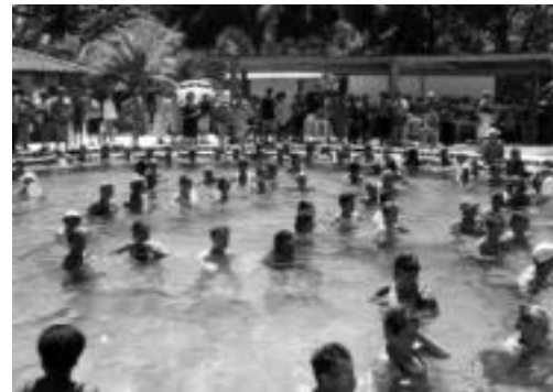
As piscinas estão sempre lotadas de turistas

peratura chegando a 37°C e não só hotéis, mas clubes também ficaram lotados. Há muitos turistas que vêm passar o dia, pegar uma piscina, almoçar e relaxar neste SPA a céu aberto que é Caldas Novas.