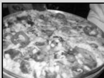
Pizza melo portuguesa e frango com catupiry