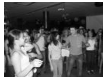
Casa cheia e muita animação