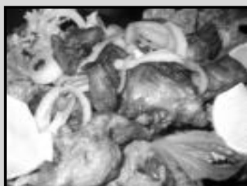
Frango à passarinho