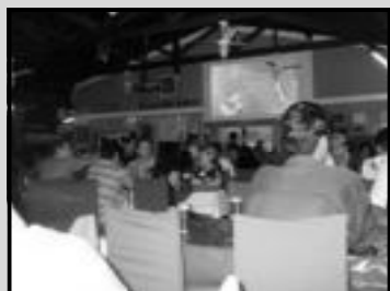
Quarta do Chopp