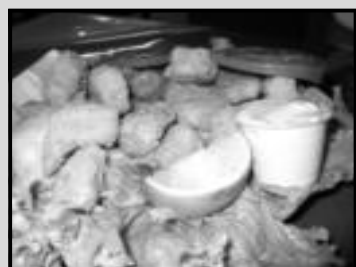
Filets de peixe