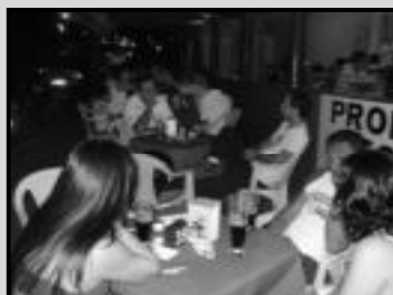
Sexta do Pagode