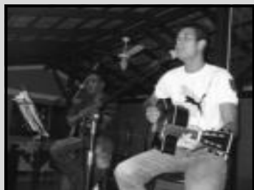
Dever e Leo - Quarta do Chopp

Segatto são os gerentes da noite e anunciam que já tem torre de chopp. A Casa do Chopp fica na Avenida Tiradentes Qd: 11 Lt: 24, Bandeirantes. Fone: (64) 3453-7474. Aparece lá para aparecer no Holofote!