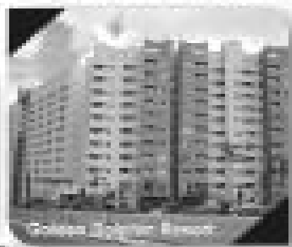
Apartamentos Residencial Thermas do Bandeirante, Com 24 unidades, 11 unidades sociais e 13 unidades