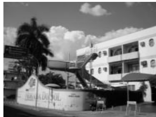
O Morada do Sol tem trabalhado com 100% de ocupação

O clima quente na maior parte do ano, a atração das águas termais, somados a ampla cadeia de hotéis, restaurantes e resorts parece estar fazendo a diferença para Caldas Novas. Nem mesmo o período de chuvas que se aproxima espanta o turista: "mesmo com chuva dá pra aproveitar a piscina quanti-