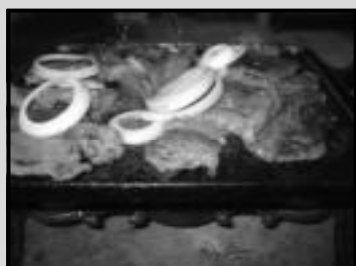
Picanha na brasa