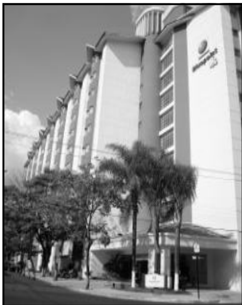
Hotéis maiores tem movimento considerado normal

O período que engloba os meses de setembro a novembro em Caldas Novas é considerado como baixa temporada. Em 2008, ainda existe o problema dos feriados nacionais prolongados, que praticamente inexistem. O feriado de 7 de setembro caiu no domingo, outubro não terá feriados e 15 de novembro, feriado de proclamação da República, será num sábado. Mas esses fatores não desanimam a classe hoteleira. Os números falam por si próprios: as reservas para o último fim de semana (27 e 28 de setembro) indicavam que grande parte dos empreendimentos estava com ocupação de 100% dos leitos.