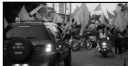
Comemoração: Caldas Novas pintou-se de verde