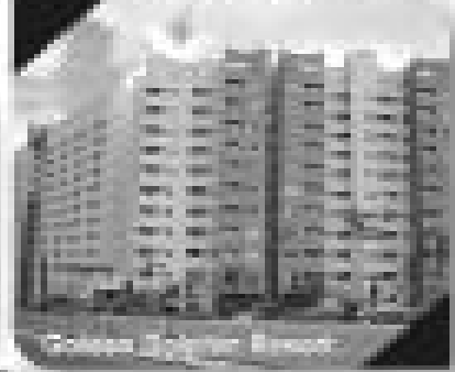
Apartamento Residencial Thermas do Bandeirante, Com 24 suites, Tríplice sala, cozinha e banheiro