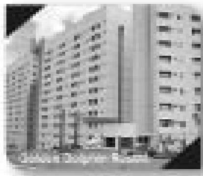
Apartamento Flat Sol na praia, com vista panorâmica, área de lazer completa

Fone: (64) 3453-6006 Av. Antônio Sanches Fernandes, Qd. 12 Lt. 01 - Riquelme