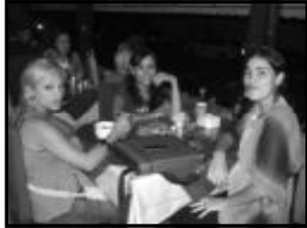
Quarta do Chopp