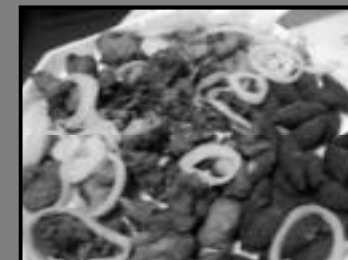
Porção de Frango à passarinho e Kibe