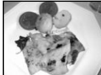
Filé de pintado com batata soubé