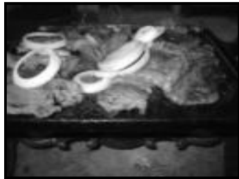
Picanha na chapa