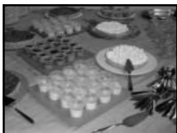
Mouse de maracujá, torta de Ilmao e quindim