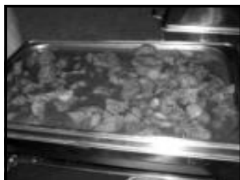
File ao molho madeira