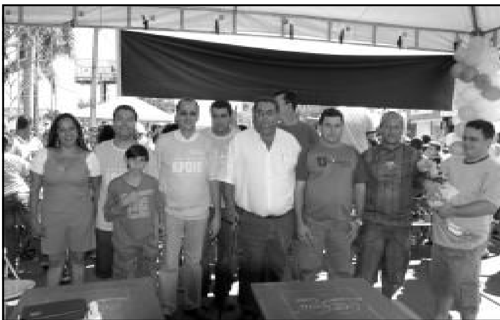
Prefeitura e Secretarias reuniram-se para promover uma festa para o dia das crianças com atividades o dia todo

A Av. Orcalino Santos foi fechada para abrigar toda a estrutura que foi montada para receber as crianças da cidade. O Parque de Diversões que fica ao lado da Prefeitura foi liberado para todas as crianças durante todo o dia e também foram instalados outros brinquedos, como cama-elástica, pular, escorregadores e demais brinquedos infantis. Também foram instaladas tendas de apoio que ajudaram na distribuição de pipoca, sorvete, picolé, algodão doce e ingressos