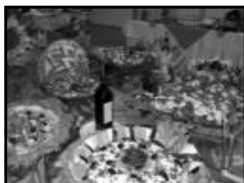
Salada de folhas, salada russa e taboa de frios

A Zuum Choperia abre nos finais de semana, com ótimas promoções. Pizza grande a R$10,90, porção de batata-frita a R$ 3,90, porção de frango a