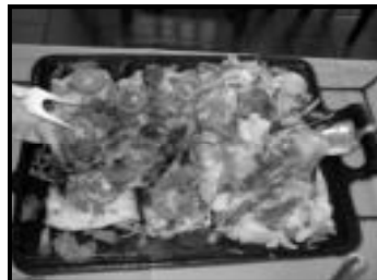
Filé de Tucunaré na brasa com legumes