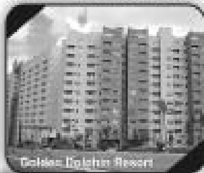
Golden Dolphin Resort

Apartamento tipo Flat Sol da montã, cozinha americana, área de lazer completa