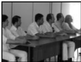
Diretores da Acican