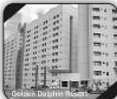
Golden Dolphin Resort

Apartamento tipo Flat Sol da montã, cozinha americana, área de lazer completa