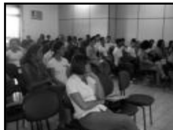
Participantes da palestra