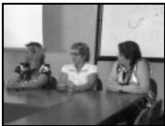
Diretoras da Acican