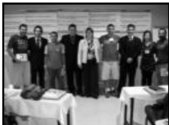
Instrutores e participantes