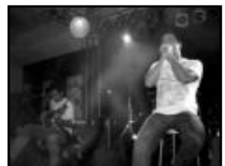
Show do Mr