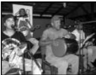
Sambacana - Casa do Chopp