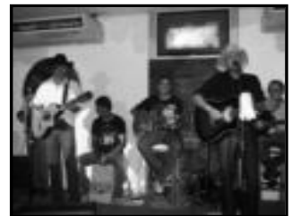
Quartanaja Zuum Disco Club