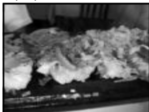
Tucunaré na brasa com legumes