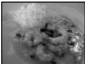
Chiclete de Camarão

A Zuum Choperia é uma ótima opção para locação para festas de aniversário, festas de formatura, confraternização de final de ano ou o que você