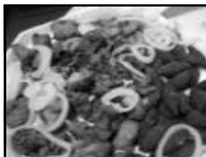
Frango à passarlho e Kibe