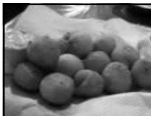
Bolinhas de queijo

veite pra chegar mais cedo e comer alguma coisa deliciosa. A Zuum Choperia fica na Rua do Turismo 404, A. Fone: (64) 3455-4100.