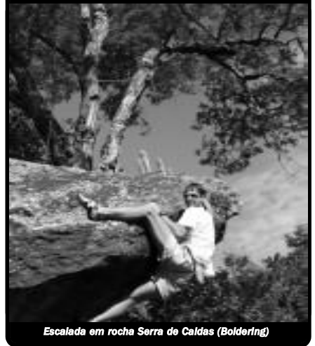
Escalada em rocha Serra de Caldas (Boldering)