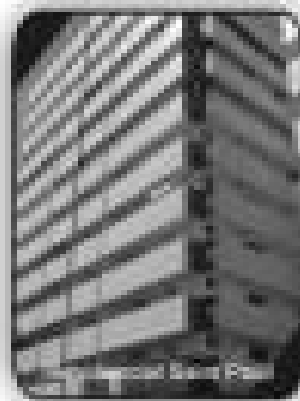
3/4 sendo 2 suítes, 3 varandas, sala, cozinha, área de serviço, banheiro social por R$ 179.000,00