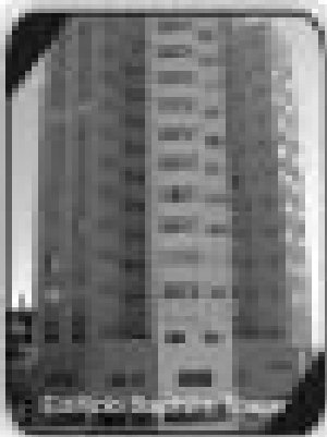
1/4 sala, cozinha, banheiro social, mobiliado por apenas R$ 90.000,00