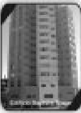
1/4 sala, cozinha, banheiro social, mobiliado por apenas R$ 90.000,00