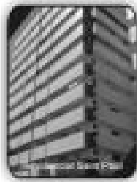
3/4 sendo 2 suítes, 3 sacadas, sala, cozinha, área de serviço, banheiro social por R$ 175.000,00