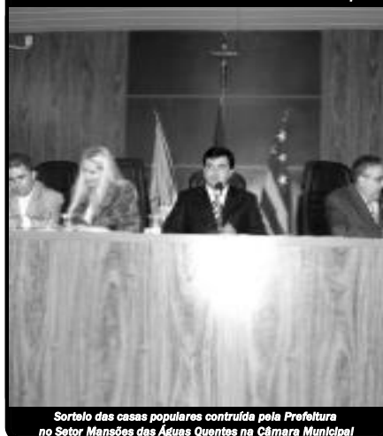
Sorteio das casas populares contruída pela Prefeitura no Setor Mansões das Águas Quentes na Câmara Municipal