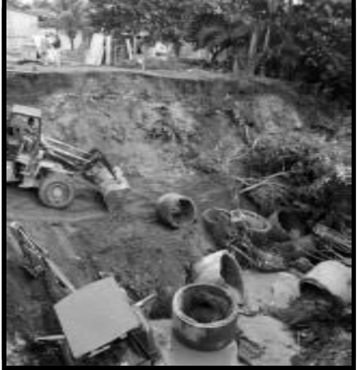
Estragos da chuva de sexta-feira em Caldas Novas