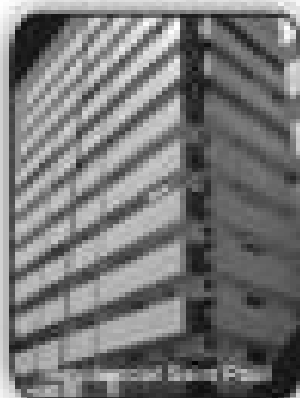
3/4 sala, 2 suítes, 3 banheiros, sala, cozinha, área de serviço, banheiro social por R$ 179.000,00