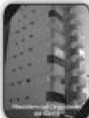
2/4 sala, 1 suíte, sala com 2 ambientes, cozinha, área de serviço, banheiro social por R$ 75.000,00