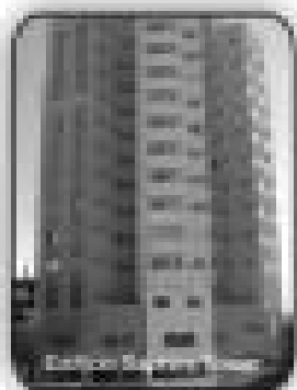
1/4, sala, cozinha, banheiro social, mobilidade por apenas R$ 90.000,00