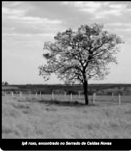
Ipê roxo, encontrado no Serrado de Caldas Novas