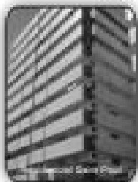
2/4 sendo 2 suites, 3 sacadas, sala, cozinha, área de serviço, banheiro social por R$ 175.000,00