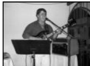
Musico de MPB