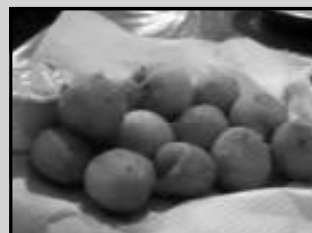
Bolinhas de queijo

Sugiro a porção de bolinhas de bacalhau e o frango a passarinho. A Zuum Choperia fica na Rua do Turismo 404, A. Fone: (64) 3455-4100.