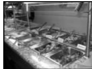
Buffet do almoço