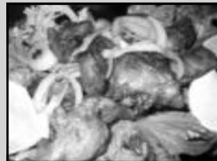
Frango à passarinho