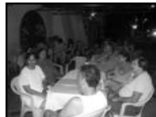
Turistas no Jantar

A Zuum Choperia é uma ótima opção para locação para festas de aniversário, confraternizações ou o que você imaginar para reunir os amigos