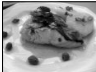
Salmão ao molho de alcaparras