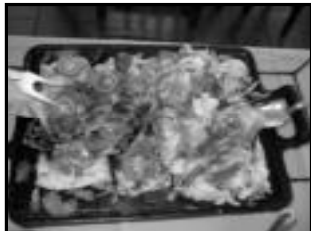
Tucunaré na chapa