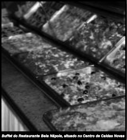
Buffet do Restaurante Bela Nápole, situado no Centro de Caldas Novas