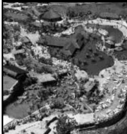
Imagem aérea do Complexo do Hot Park Resort's situado no município de Rio Quente, com 29 Km de distância de Caldas Novas