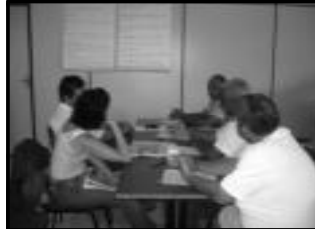
Grupo de trabalho Governança