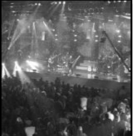
Mega estrutura do Show no DÍRoma em Caldas Novas Gravação do DVD - Dudu & Vanilli