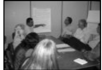
Grupo de trabalho Mercado