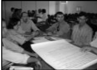
Grupo de trabalho Capacitação