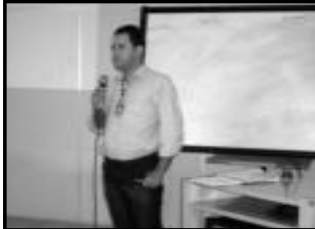
Christian - Gols Turismo