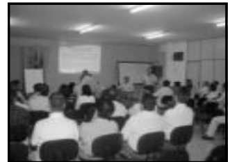
Participantes da Oficina