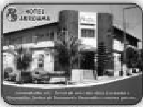
Hotel Arvoreal em Condomínio 100 com 24 apartamentos, piscina, churrasqueira, lavanderia, sala de café da manhã, localização privilegiada (próximos a Itaipu)

VENDA: Apartamentos de 1/4, sala, cozinha, banheiro social, sacada, no Condomínio Golden Thermas Residence Sapphire Tower, (com acesso ao clube CTC) Apartamento de 2/4 sendo 1 suite, sala 2 ambientes, cozinha, área de serviço, banheiro social, 2 sacadas, no Residencial Orquídeas da Serra. Apartamento de 3/4 sendo 2 suites, sala 2 ambientes, cozinha, área de serviço, banheiro social, 3 sacadas, no Residencial Saint Paul. Apartamento de 1/4, sala, cozinha, banheiro social, varanda e garagem no Náutico Praia Fiat Service. Casa Setor Bandeirantes com 4/4, sendo três suites, sala, cozinha, banheiro social, área de serviço e garagem Casa Averbada Setor Belvedere com 2/4 sendo uma suite, sala, cozinha, banheiro social, área de serviço e garagem. R$ 68.000,00. Casa Averbada Setor Bandeirantes com 3/4 sendo duas suites, sala, cozinha, banheiro social, área de serviço, churrasqueira, garagem. Sala Comercial Avenida B com 250 m2, Excelente localização. ALUGUEL NA MATRIZ: Sobrado no setor Serrinha, com 4/4 sendo 3 suites, 2 salas, banheiro social, cozinha, copa, área de serviço, 1 despensa e área de churrasco, garagem. R$ 600,00. ALUGUEL NA FILIAL: Sobrado com 4/4 sendo 3 suites no Itaguaí I. R$ 900,00