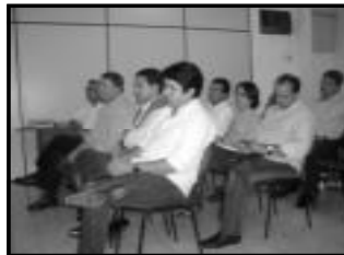
Participantes da Oficina