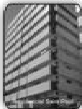
2/4 sendo 2 suites, 3 sacadas, sala, cozinha, área de serviço, banheiro social por R$ 179.000,00