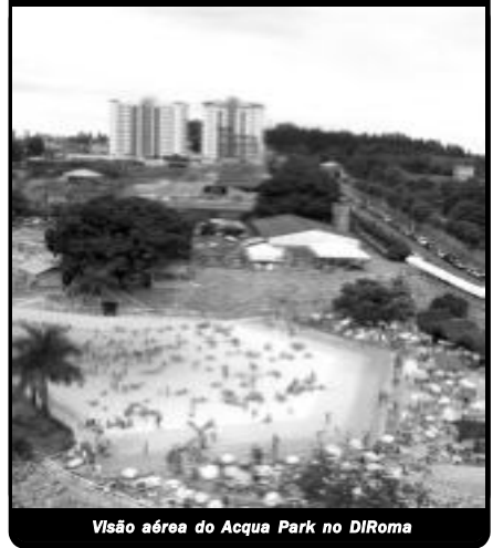
Visão aérea do Acqua Park no DI Roma