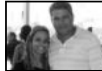
Prefeito de Rio Quente Ênio e esposa