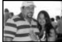
Fulano - Presidente da Câmara de Rio Quente