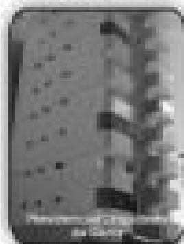
2/4 sendo 1 suite, banheiro 3 ambientes, cozinha, área de serviço, churrasqueira, R$ 75.000,00