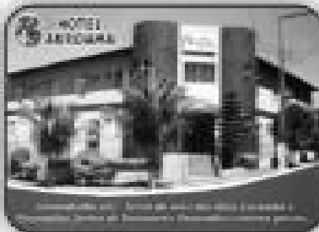
Hotel Anjo Real em Caldas Novas - GO com 24 apartamentos, piscina, churrasqueira, lavanderia, sala de café da manhã, localização privilegiada (próximos a Itaipava)

Av. Antônio Bandeira Fernandes Qd. 12 Lt. 01 - Itaguai I