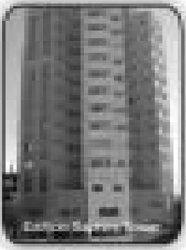
1/4, sala, cozinha, banheiro social, mobilado por apenas R$ 90.000,00

VENDA: Apartamentos de 1/4, sala, cozinha, banheiro social, sacada, no Condomínio Golden Thermas Residence Sapphire Tower, (com acesso ao clube CTC) Apartamento de 2/4 sendo 1 suíte, sala 2 ambientes, cozinha, área de serviço, banheiro social, 2 sacadas, no Residencial Orquídeas da Serra. Apartamento de 3/4 sendo 2 suítes, sala 2 ambientes, cozinha, área de serviço, banheiro social, 3 sacadas, no Residencial Saint Paul. Apartamento de 1/4, sala, cozinha, banheiro social, varanda e garagem no Náutico Praia Fiat Service. Casa Setor Bandeirantes com 4/4, sendo três suítes, sala, cozinha, banheiro social, área de serviço e garagem Casa Averbada Setor Belvedere com 2/4 sendo uma suíte, sala, cozinha, banheiro social, área de serviço e garagem. R$ 68.000,00. Casa Averbada Setor Bandeirantes com 3/4 sendo duas suítes, sala, cozinha, banheiro social, área de serviço, churrasqueira, garagem. Sala Comercial Avenida B com 250 m2, Excelente localização. Aluguel mensal na Matriz: Sobrado no setor Serrinha, com 4/4 sendo 3 suítes, 2 salas, banheiro social, cozinha, copa, área de serviço, 1 despensa e área de churrasco, garagem. R$ 600,00. ALUGUEL NA FILIAL: Sobrado com 4/4 sendo 3 suítes no Itaguai I. R$ 900,00