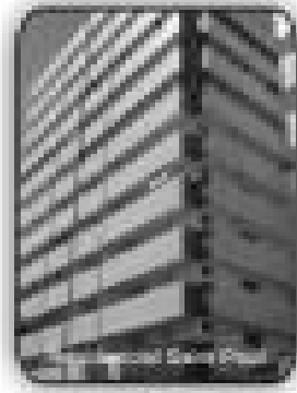
2/4 sendo 2 suítes, 3 sacadas, sala, cozinha, área de serviço, banheiro social por R$ 175.000,00