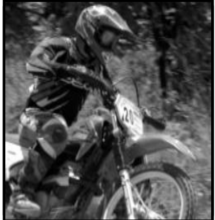
Rally das Águas Quentes