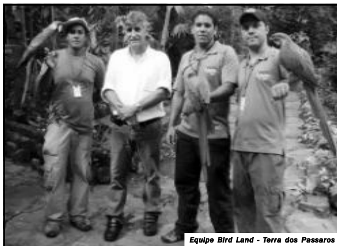
Equipe Bird Land - Terra dos Passaros

dentro do abrigo por terem sido mutilados pela ação dos criminosos (dificultando seu retorno ao habitat) e acabaram se tornando vedetes do local, hoje visitado por inúmeras pessoas de todo o Brasil e exterior. Quando for a Rio Quente – GO, visite BIRD LAND – A Terra dos Pássaros.