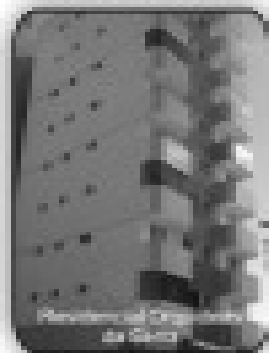
2/4 sendo 1 suite, sala com 3 ambientes, cozinha, área de serviço, churrasqueira, R$ 175.000,00