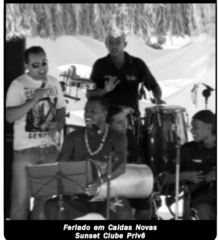
Feriado em Caldas Novas Sunset Clube Privé