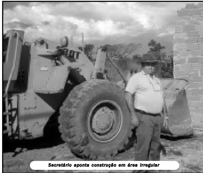
Secretário aponta construção em área irregular

Secretário de Meio Ambiente realiza série de ações em apenas 3 meses