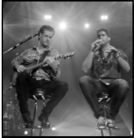
Semana Santa: Caldas Novas Festival - Vitor & Léo