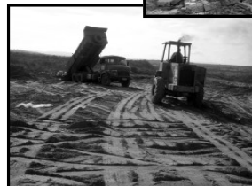
Aterro coberto em ação da secretaria de Meio Ambiente