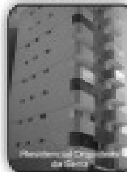
2/4 sendo 1 suite, sala com 3 ambientes, cozinha, área de serviço, churrasqueira, R$ 175.000,00