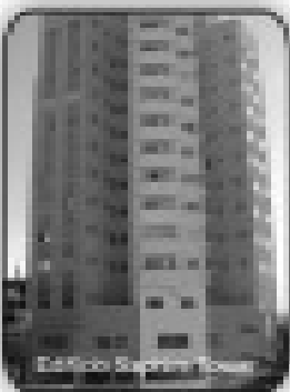
1/4, sala, cozinha, banheiro social, mobília por apenas R$ 90.000,00

Sobrado com 4/4 sendo 3 suites no Itaguai I. R$ 900,00