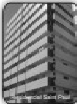
2/4 sendo 2 suites, 2 sacadas, sala, cozinha, área de serviço, banheiro social por R$ 179.000,00