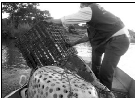
Fiscalização no Lago Corumbá

Com o apoio das secretarias de Ação Urbana e Transporte, que contribuíram com parte de seu efetivo e