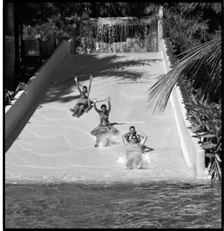
Em Caldas Novas, diversão não tem idade; na foto, escorregador do Lagoa Thermas Parque