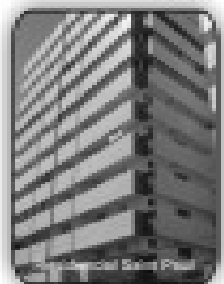
2/4 sendo 2 suítes, 3 sacadas, sala, cozinha, área de serviço, banheiro social por R$ 179.000,00