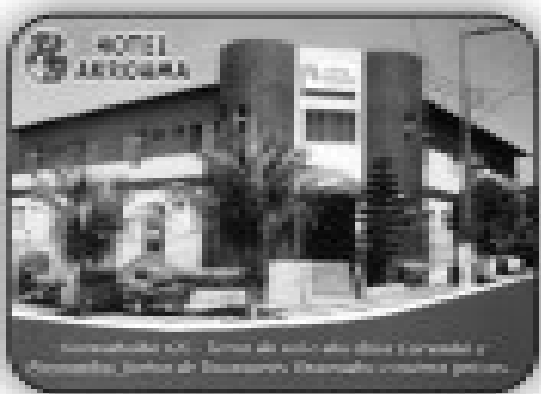
Hotel Arcoíris em/Corumbaltes-GO com 24 apartamentos, piscinas, churrasqueiras, lavanderia, sala de café da manhã, localização privilegiada (próximo a fazendas).

VENDA: Apartamentos de 1/4, sala, cozinha, banheiro social, no Condomínio Golden Thermas Residence Sapphire Tower. (com acesso ao clube CTC) Apartamento de 2/4 sendo 1 suíte, sala 2 ambientes, cozinha, área de serviço, banheiro social, 2 sacadas, no Residencial Orquídeas da Serra. Apartamento de 3/4 sendo 2 suítes, sala 2 ambientes, cozinha, área de serviço, banheiro social, 3 sacadas, no Residencial Saint Paul. Apartamento de 1/4, sala, cozinha, banheiro social, varanda e garagem no Náutico Praia Flat Service. Casa Setor Bandeirantes com 4/4, sendo tres suítes, sala, cozinha, banheiro social, área de serviço e garagem ragem Casa Averbada Setor Belvedere com 2/4 sendo uma suíte, sala, cozinha, banheiro social, área de serviço e garagem. R$ 68.000,00. Casa Averbada Setor Bandeirantes com 3/4 sendo duas suítes, sala, cozinha, banheiro social, área de serviço, churrasqueira, garagem. Sala Comercial Avenida B com 250 m2, Excelente localização. Aluguel mensal na Matriz: Sobrado no setor Serrinha, com 4/4 sendo 3 suítes, 2 salas, banheiro social, cozinha, copa, área de serviço, 1 despensa e área de churrasco, garagem. R$ 600,00. ALUGUEL NA FILIAL: Sobrado com 4/4 sendo 3 suítes no Itaguai I. R$ 900,00