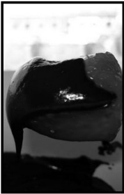
Fondue de chocolate preto