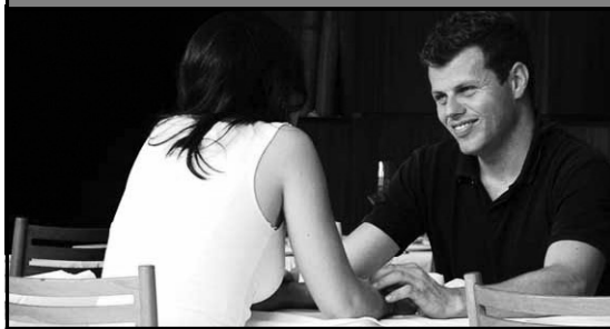
Namoro no trabalho, pode?