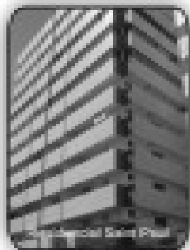
2/4 sendo 2 suites, 2 sacadas, sala, cozinha, área de serviço, banheiro social por R$ 179.000,00