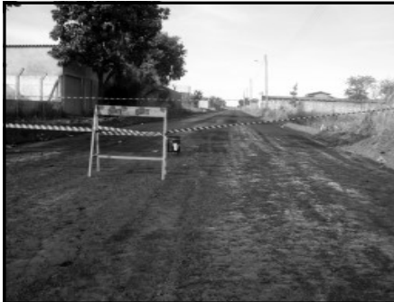
O setor Caldas d'Oeste, que tem recebido melhorias realizadas pela administração municipal desde o ano passado, com a implantação da 1ª etapa de asfalto em ruas daque-

le bairro, recebeu também a partir de abril deste ano os meios fios e canteiros, bem como a implantação da rede de água.