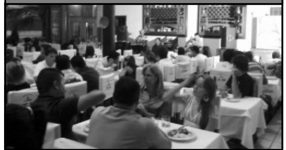
Organizadores da Churrascada Universitária comemoram sucesso do evento