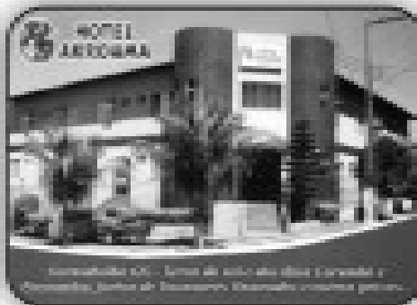
Hotel Arcoíris em Caldas Novas-GO com 24 apartamentos, piscina, churrasqueira, lavanderia, sala de café da manhã, localização privilegiada (próximo a Itaipava).

Av. Antônio Sanchez Fernandes Qd. 12 Lt. 61 - Itaguai I