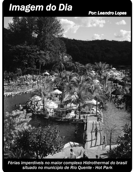
Férias imperdíveis no maior complexo hidrotermal do Brasil situado no município de Rio Quente - Hot Park

A Metrobus entrega cinco novos ônibus. Os veículos, que já estão na Praça Cívica, em Goiânia, custaram R$ 2,2 milhões. Os ônibus começam a circular na quarta-feira, às 5h. Até o final do ano outros 40 serão adquiridos. De acordo com o presidente Francisco Gedda, o objetivo é dar comodidade e conforto aos mais de 180 mil usuários do Eixo Anhanguera. Hoje a frota é composta por 110 veículos com média de dez anos de uso.