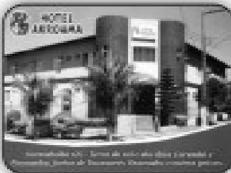
Hotel Mirasol em Coimbra-GO com 04 apartamentos, piscina, churrasqueira, lavanderia, sala de café da manhã, localização privilegiada (próximo a Itaipava).

Av. Antônio Sanchez Fernandes Qd. 12 Lt. 01 - Itaguaí I