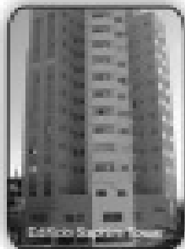
014, sala, cozinha, banheiro social, mobilizado por apenas R$ 90.000,00

Sobrado com 4/4 sendo 3 suítes no Itaguaí I. R$ 900,00