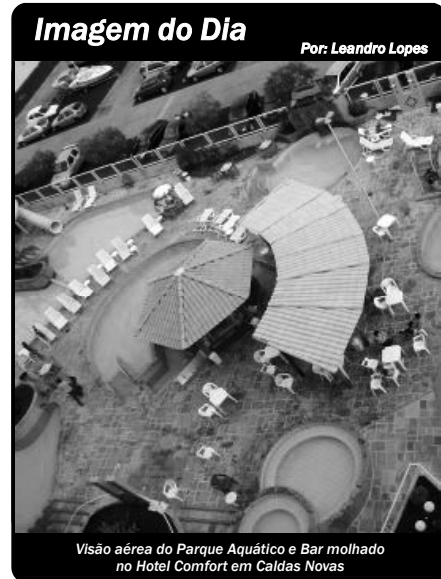
Imagem do Dia Visão aérea do Parque Aquático e Bar molhado no Hotel Comfort em Caldas Novas

As Unidades Prisionais de Novo Gama, Santo Antônio do Descoberto e Valparaíso serão reformadas e ampliadas. O investimento é de mais de R$ 1,5 milhão, proveniente dos governos Estadual e Federal, via Pronasci. As obras devem ser concluídas em 120 dias.