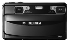
Botões na traseira da câmera da Fuji permitem que o usuário escolha captar imagens em 2D ou 3D.

A Fujifilm Holdings afirmou na última semana do mês de julho, que planeja lançar a primeira câmera digital 3D do mundo. A FinePix Real 3D W1, que inclui duas lentes e dois chips sensores de imagens para possibilitar imagens tridimensionais, deve chegar ao mercado japonês ainda neste mês, por cerca de 60 mil ienes (US$ 641), segundo uma porta-voz da companhia.