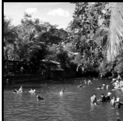
Esplanada do Rio Quente. Um rio de água quente cercado por uma estrutura de camping e lazer.