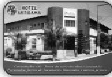
Residência em Condomínio - 03 por 24 apartamentos, piscina, churrasqueira, lavanderia, sala de lazer, academia, bicicletário-clubhouse (próximo à praia)

Telefone: 3453-6006 Av. Antônio Sanchez Fernandes Qd. 12 Lt. 81 - Itaguaí