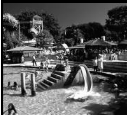
Parque Aquático DI Roma - Caldas Novas