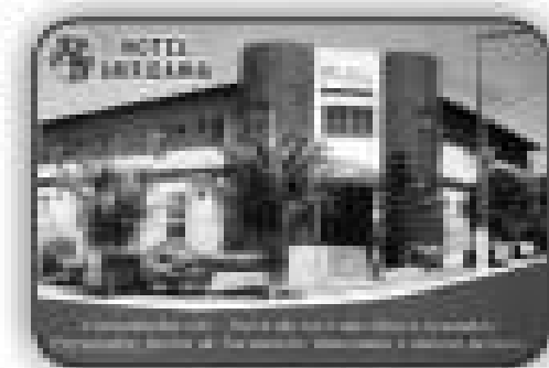
Hotel Interlagos em Itaguaí - 60 por 24 apartamentos, piscina, churrasqueira, lavanderia, sala de café da manhã, localidade privilegiada (próximo shopping)