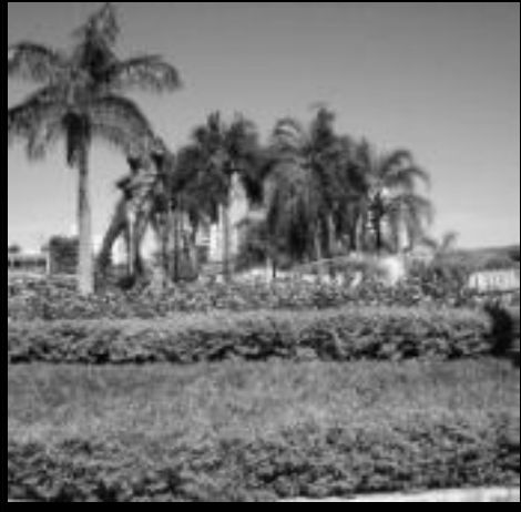
Praia da Falda da Lua em Caldas Novas