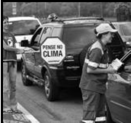
Ativistas do Greenpeace se vestem de guardas de trânsito em SP e multam motoristas por culpa no aquecimento global