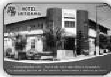
Hotel Lagoinha em Itaipava - 100 por 24 apartamentos, piscina, churrasqueira, lavanderia, sala de café, salão de festas, quadra de tênis, academia, playground, estacionamento.

Fone: (64) 3453-6006 Av. Antônio Sánchez Fernandes Qd. 12 Lt. 81 - Itaipava I