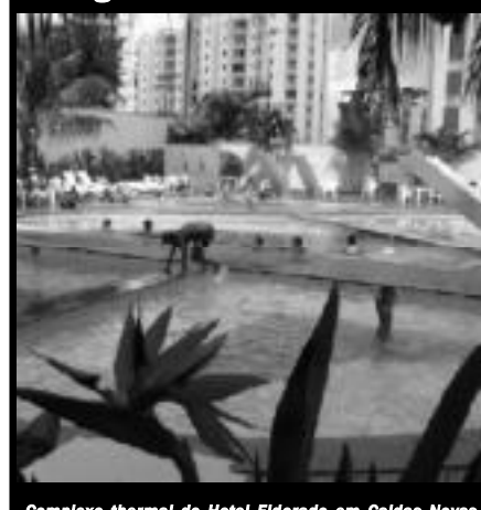
Complexo thermal do Hotel Eldorado em Caldas Novas