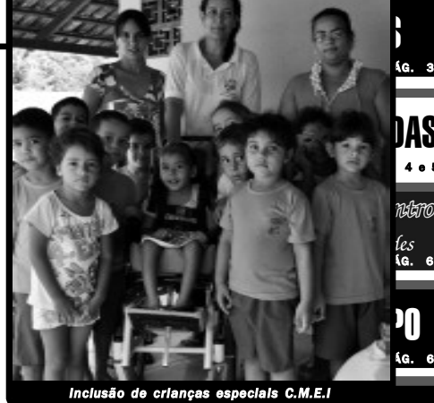
Inclusão de crianças especiais C.M.E.I