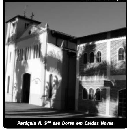
Paróquia N. S.ª das Dores em Caldas Novas