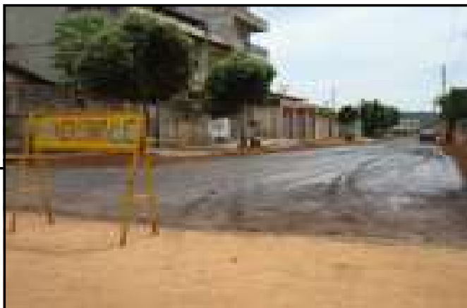
setores Jardim Serrano e Jardim Paraíso.

Atenção empresas que produzem materiais diversos usados para a pavimentação asfáltica. A Prefeitura Municipal de Caldas Novas divulgou Edital de Licitação (036/2010) para adquirir Brita, Pó de Brita, Areia Grossa, Cimento Comum. A matéria-prima será usada na pavimentação asfáltica dos