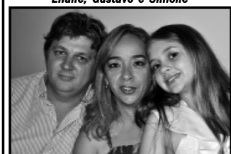
Família CONCRETA PRE MOLDADOS