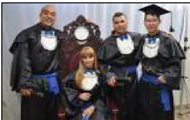
Segunda turma de formandos prova que cursos EAD são o futuro

A formatura da segunda turma dos cursos de gestão da UNIP – Polo Caldas Novas já é realidade. Há menos de um mês aconteceu a solenidade, que compreende estudantes do método SEPI (Sistema de Ensino Presencial Interativo). A turma é composta de cinco alunos, dos cursos de Gestão em Sistemas de Informação, Gestão em Recursos Humanos e Gestão de Pequenas e Médias Empresas. A formatura foi motivo de grande alegria, pois re-